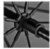
Mehr Komfort beim Öffnen durch den Sicherheitsschieber