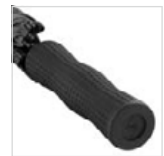
Exklusiver Griff in besonderem Golf-Design mit Werbeanbringungsmöglichkeit