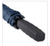
Exklusiver, quadratischer Griff mit quadratischer Werbeanbringungsmöglichkeit