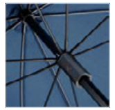
Neuartiger, quadratischer Sicherheitsschieber