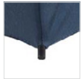
Schwarze, quadratische Kunststoffspitzen