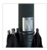
Griff mit integrierter Auslösetaste (laserfähig), Laserbeispiel