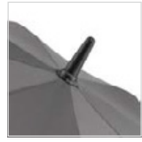
Mattes Kunststofftop mit rutschhemmender Gummizwinge