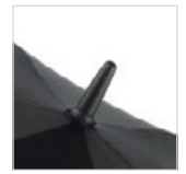
Soft-Touch-Top mit rutschhemmender Gummizwinde