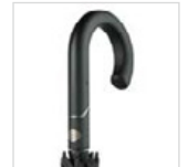
Soft-Touch-Griff mit integrierter Auslösetaste in grau-metallic