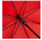
Schwarzer Stahlstock mit Fiberglasschienen