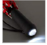
Einmal drücken: weißes Dauerlicht