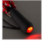
Zweimal drücken: rotes Blinklicht