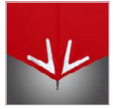
3M™ Scotchlite™ Reflective Material