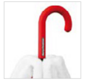
Soft-Touch-Griff mit Werbeanbringungsmöglichkeit