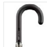
Soft-Touch-Rundhakengriff mit Werbeanbringungsmöglichkeit