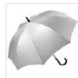
Außenseite in Silber, Innenseite in Rot, Dunkelblau oder Schwarz