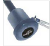
Transluzenter Griff in Titanfinish mit Werbeanbringungsmöglichkeit