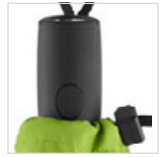
Griff mit Auslösetaste