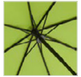
Windproof-System mit FARE®-FlexBar Kunststoffschienen