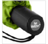
Soft-Touch-Griff mit Werbeanbringungsmöglichkeit