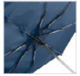
Windproof-System mit Fibertec-Schienenkonstruktion