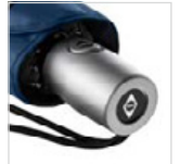
Kunststoffgriff in Alu-Finish mit Werbeanbringungsmöglichkeit