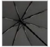
Windproof-System mit Fibertec-Schienenkonstruktion