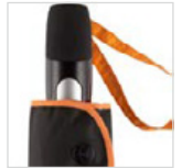
Matt/glänzend unterteilter Soft-Touch-Griff und Trageschleife in passender Kontrastfarbe