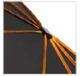
Bezug mit farbigen Keilnahtpaspeln