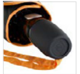
Griff mit integrierter Auslösetaste und Werbeanbringungsmöglichkeit