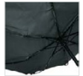
Windproof-System mit FARE®-FlexBar Kunststoffschienen