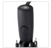
Soft-Touch-Griff mit Auslösetaste und Werbeanbringungsmöglichkeit