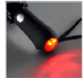
Zweimal drücken: rotes Blinklicht