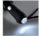
Einmal drücken: weißes Dauerlicht