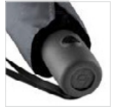
Griff mit integrierter Auslösetaste und Werbeanbringungsmöglichkeit