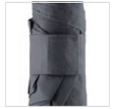
Extra breites Schließband