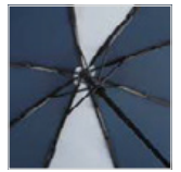
Windproof-System mit Fibertec-Schienenkonstruktion

... und auf der Paspel an den übrigen 6 Keilen