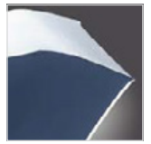
Zwei Keile und Paspeln mit farbiger, reflektierender Beschichtung