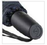
Soft-Touch-Griff mit Werbeanbringungsmöglichkeit