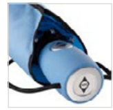
Soft-Touch-Griff mit silberner Auslösetaste und Werbeanbringungsmöglichkeit