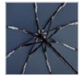
Windproof-System mit Fibertec-Schienenkonstruktion