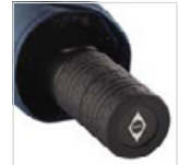
Soft-Touch-Griff im Reifenprofil-Design mit integrierter Auslösetaste und Werbeanbringungsmöglichkeit