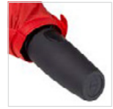
Soft-Touch-Griff mit Werbeanbringungsmöglichkeit