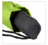
Soft-Touch-Griff mit Werbeanbringungsmöglichkeit