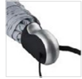
Exklusiver ergonomischer Griff