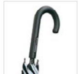
Soft-Touch-Rundhaken-griff mit Werbe-anbringungsmöglichkeit