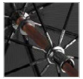
Schieber und Krone verchromt