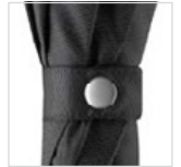
Schließband mit verchromtem Druckknopf