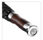
Echtholzgriff mit verchromten Applikationen und Werbeanbringungsmöglichkeit