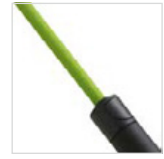
Stahlstock mit farbiger Kunststoffummantelung