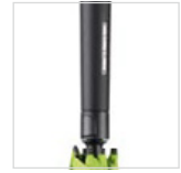
Exklusiver Soft-Touch-Griff mit Auslösetaste