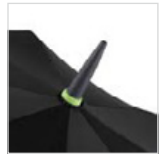
Top mit Farbring