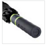
Griff mit zwei Werbeanbringungsmöglichkeiten