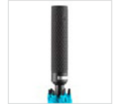
Soft-Touch-Griff mit Werbeanbringungs-möglichkeit