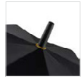
Rosette auf Bezug-Innenfarbe angepasst