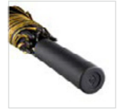
Griff mit zwei Werbeanbringungsmöglichkeiten