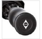
Griff mit Werbeanbringungs-möglichkeit