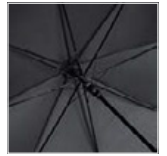
Schwarzer Stahlstock mit Fiberglasschienen