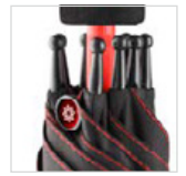
Auslösetaste mit Doring-Beispiel