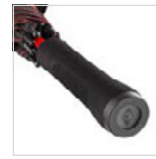
Softgriff mit zwei Werbeanbringungsmöglichkeiten