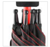
Auslösetaste mit Werbeanbringungsmöglichkeit