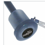
Griff in Titanfinish transluzent mit Doming-Möglichkeit