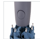
Spezialbeschichteter Griff mit Auslösetaste und Doming-Möglichkeit