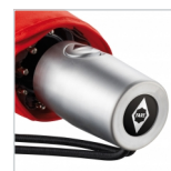
Kunststoffgriff in Alu-Finish mit Doming-Möglichkeit