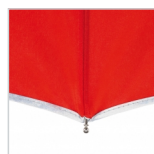
Silberne Reflexpaspel (gem. EN ISO 20471)