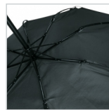
Windproof-System mit FARE®-FlexBar Kunststoffschienen