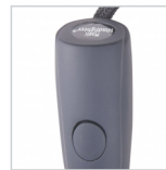
Spezialbeschichteter Griff mit Auslösetaste und Doming-Möglichkeit