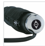
Griff mit Doming-Möglichkeit