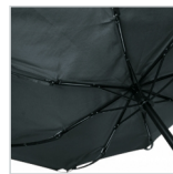
Windproof-System mit FARE®-FlexBar Kunststoffschienen