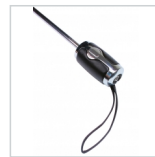
Exklusiver Ledergriff mit Auslösetaste