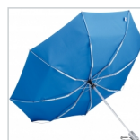
Windproof-System mit FARE®-FlexBar Kunststoffschienen