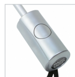
Kunststoffgriff verzinkt mit Auslösetaste und Doming-Möglichkeit