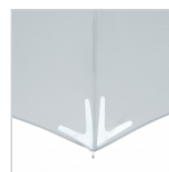
3M™ Scotchlite™ Reflective Material