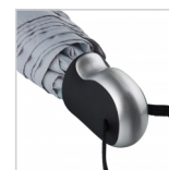
Exklusiver ergonomischer Griff