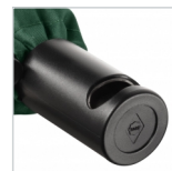
Griff mit Doming-Möglichkeit