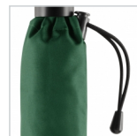
Futteral mit Elastikkordel