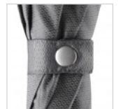
Schließband mit verchromtem Druckknopf