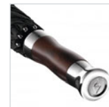
Echtholzgriff mit verchromten Applikationen und Doming-Möglichkeit