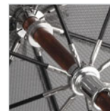
Schieber und Krone verchromt